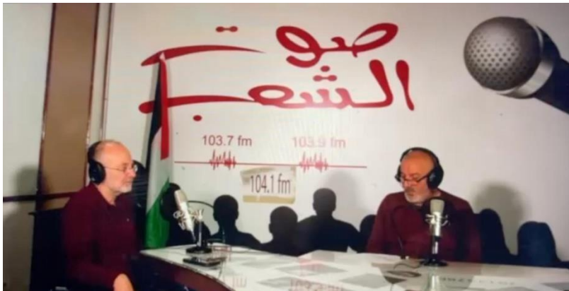
图：土共总书记奥库扬做客黎共“人民之声”电台

11月6日，土耳其共产党总书记凯末尔·奥库扬在做客黎巴嫩共产党的“人民之声”（Sawt Chaab (People's Voice)）电台后，与黎巴嫩共产党总书记汉纳·加里布举行了联合新闻发布会。