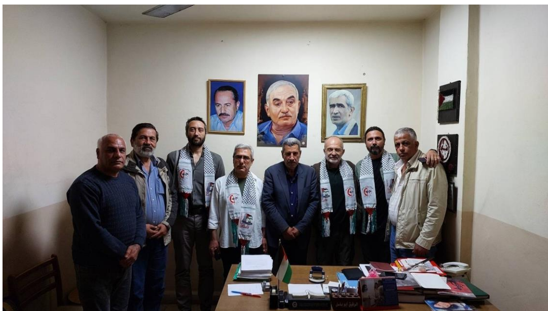
图：土耳其共产党代表与解放巴勒斯坦人民阵线代表会面