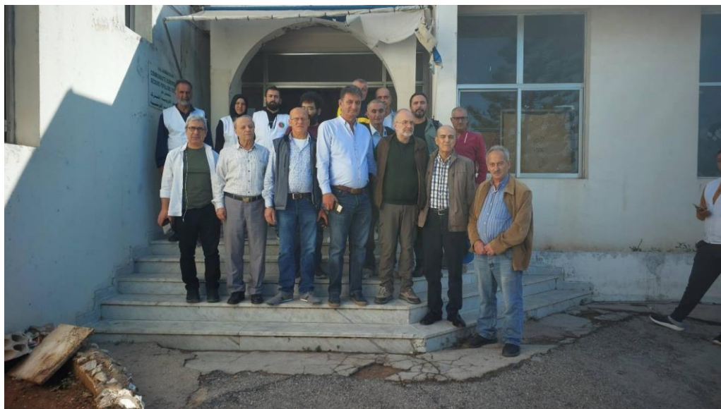
图：土耳其共产党代表到访索费尔避难所