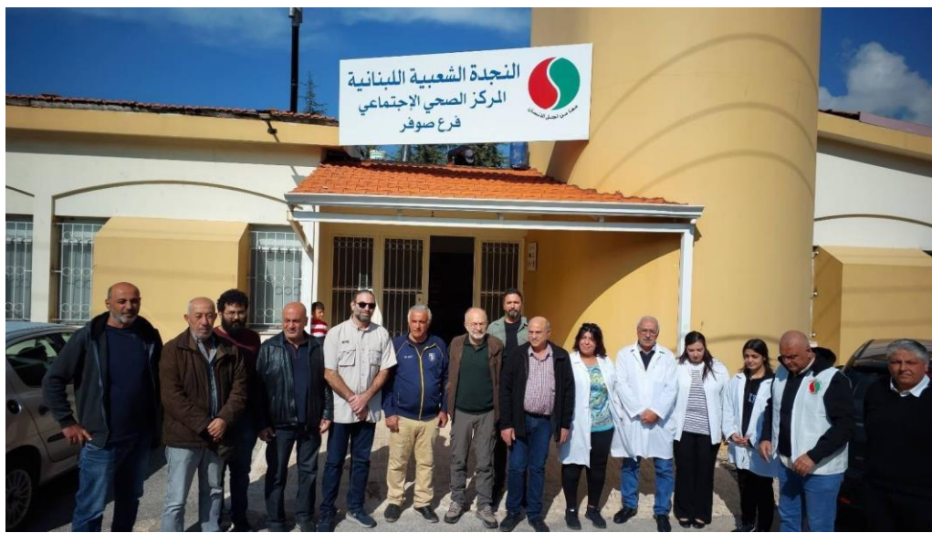
图：土耳其共产党代表到访巴尔卡避难所

心，土耳其共产党代表团与来自黎巴嫩南部的家庭做了交流，评估了在这些中心工作的管理人员和医疗人员的情况，并就如何加强团结交换了意见。