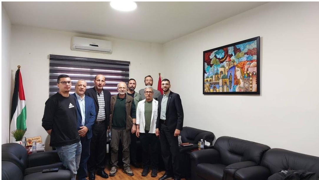
图：土耳其共产党代表与解放巴勒斯坦民主阵线代表会面