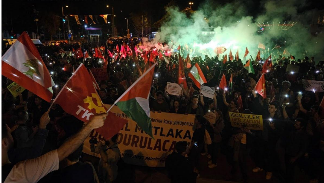
March by TKP against Israeli aggression and occupation 9 October 2024, İstanbul.