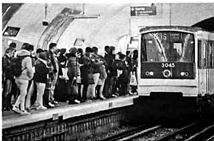
1月31日巴黎大众运输公司举行罢工，导致巴黎大量地铁乘客滞留站台。