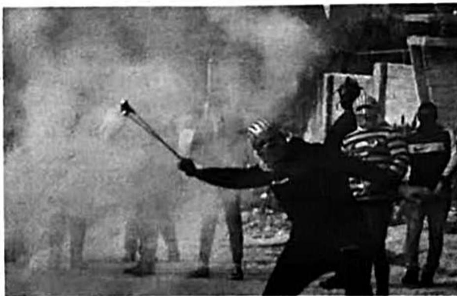
17日，巴勒斯坦示威者在西岸地区向以色列士兵投掷石块。