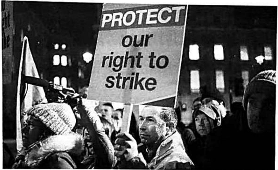
抗议人群1月30日在唐宁街游行，维护罢工权利。

【英国《泰晤士报》网站1月30日报道】题：英国消防员投票决定举行20年来首次罢工(记者 基兰·盖尔)