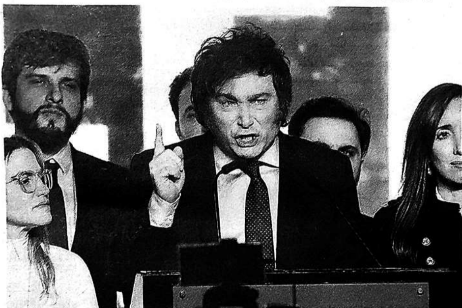
13日，阿根廷极右翼总统候选人哈维尔·米莱(中)在布宜诺斯艾利斯庆祝初选领先。

公共开支，包括对民众使用公共医疗系统收费；将所有国有企业或关闭或私有化；裁撤卫生、教育和环境部门。