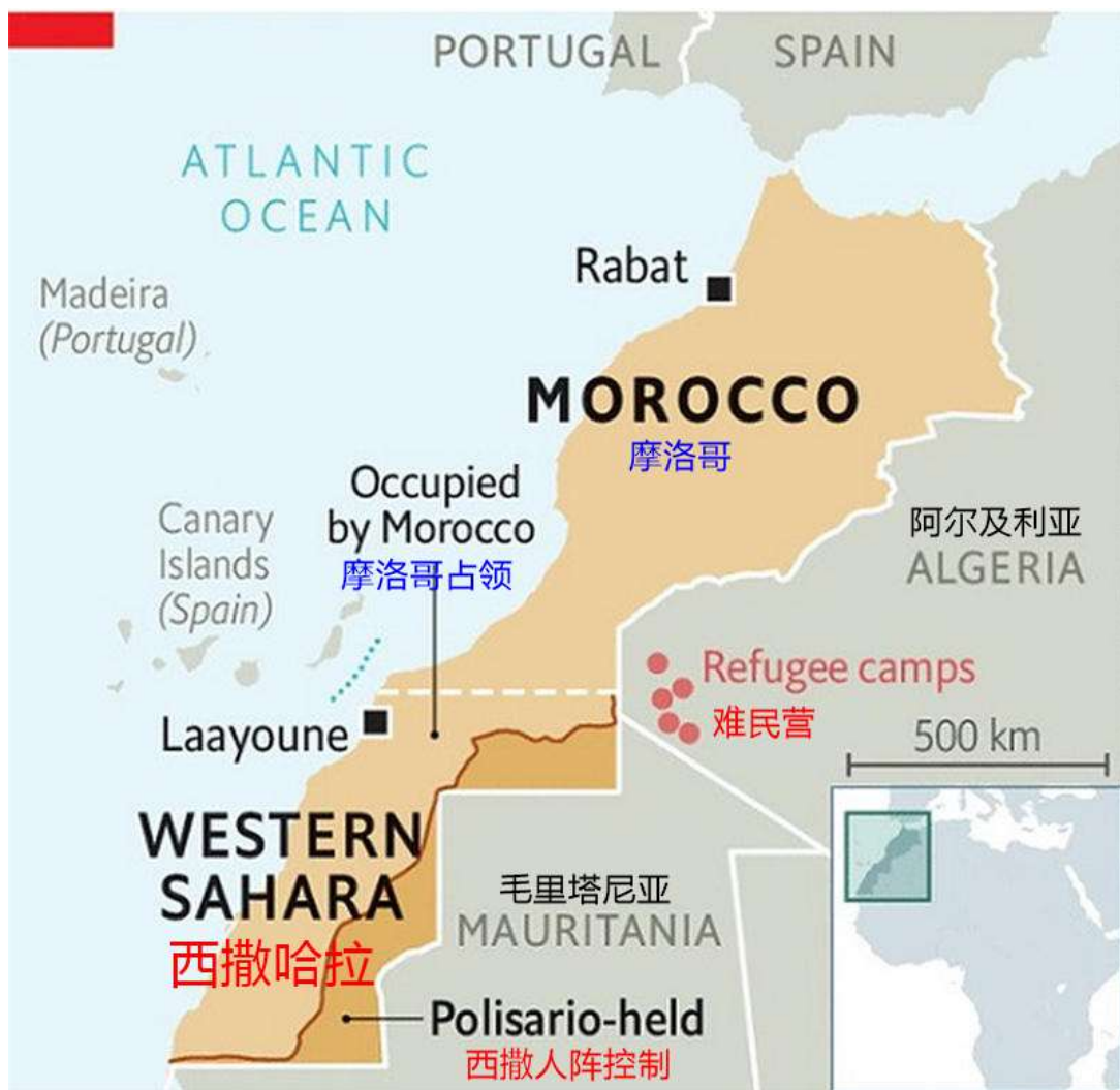
图：西撒哈拉及周边地区现状

西撒哈拉人民解放阵线的外交官欧比·巴希尔（Oubi Bachir）表示：“我当时刚从叙利亚回来，是个年轻的毕业生，我的一生都要在这个解放进程中度过。我不仅找到了希望，还感到了喜悦。我们终于要回家了。”撒哈拉人收拾行囊，准备重返西撒哈拉。