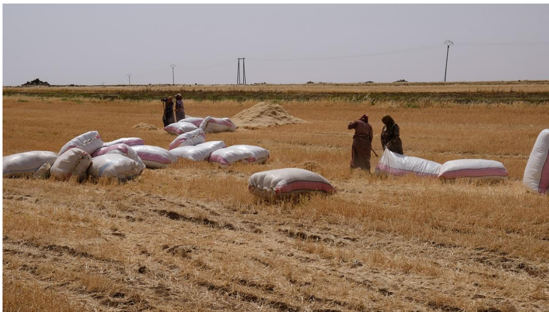
图：德里克（Derik）市收获小麦的场景