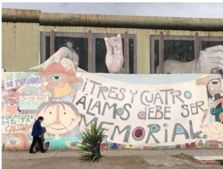
图：特雷斯-阿拉莫斯拘留中心外墙上的壁画。

特雷斯-阿拉莫斯是一个饱受争议的地方。曾经的被关押者、被谋杀者、失踪者的家属希望把这里变着一个“纪念之地”，作为一座交互式的博物馆，让人们永远不要忘记右翼镇压的恐怖，并提醒人们对任何建立法西斯独裁政权的动向保持警觉。它可能成为更大的“红色纪念地”（Red de Sitios de Memoria）的一部分，那是一个与失踪者和被谋杀者有关的文化景观。特雷斯-阿拉莫斯的所有外墙，都覆盖着纪念独裁受害者的壁画。