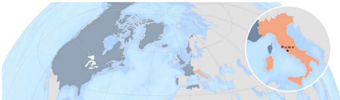
图：1949 年的北约和意大利