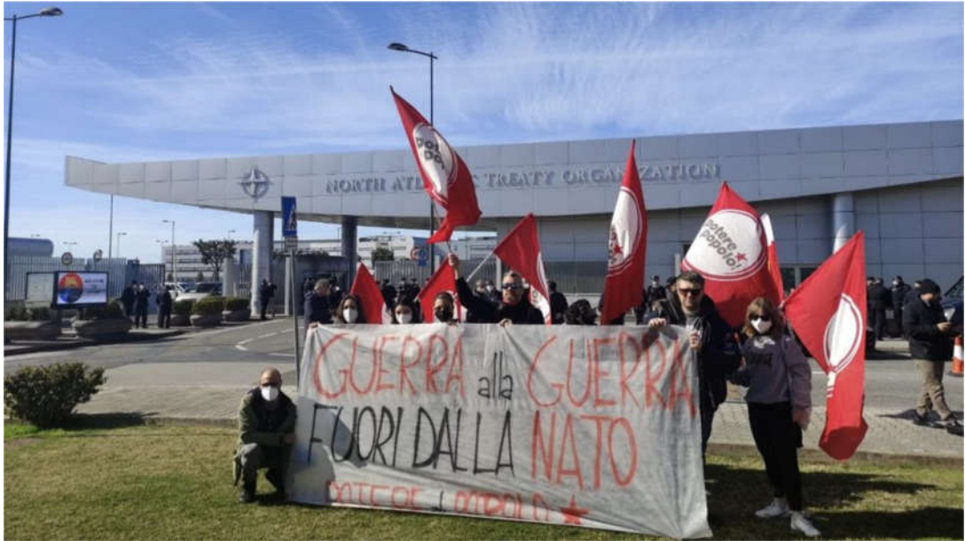
图：“权力归人民”在意大利那不勒斯的北约基地门前示威

另外，虽然意大利不被允许制造核武器，但是美国巨大核武器库中的一部分却放在意大利。这始终是冲突的重要焦点，尤其是考虑到 20 世纪 80 年代意大利曾有过大规模反核运动。布鲁内蒂说：