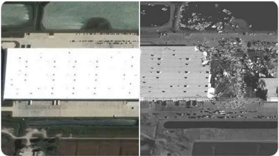
图：该仓库在龙卷风前后的卫星图

由于上班时间不允许使用手机的政策，工人们总是担心万一发生紧急情况，无法与家人取得联系。即便是遇到伊利诺斯州爱德华兹维尔（Edwardsville Illinois）的龙卷风 [2] 这样的严重事件，工人们也无法意识到危险，因为他们没有手机来获得信息。结果，仓库中的6名工人不幸遇难。