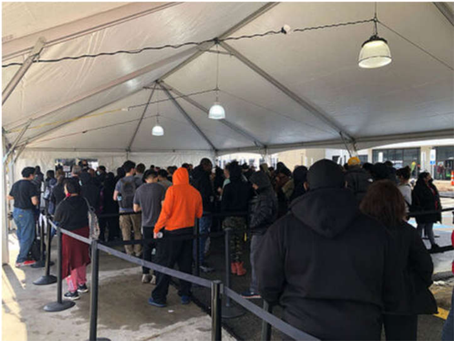
图：亚马逊 JFK8 仓库工人排队投票

在投票的第一天即 3 月 25 日，在 JFK8 号仓库的停车场搭建了一个帐篷。国家劳动关系委员会的代表负责管理投票，亚马逊公司的工人在三张桌子旁观察，手里拿着 JFK8 仓库 8000 名工人的名单。渴望创造历史的工人们排起了长队。许多工人在排队时表达了兴奋的情绪；投票者能够看到他们的同事监督着整个过程，以便确保投票是公平和合法的。